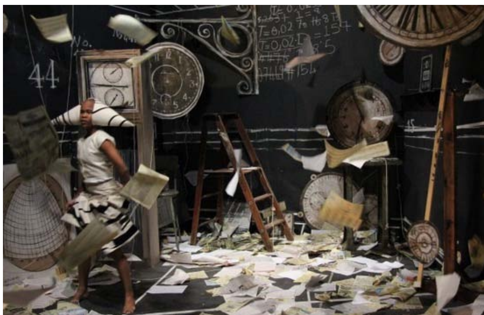
HACKING HABITAT: William Kentridge, Refusal of Time, installation, 2016 www.hackinghabitat.nl

Ondanks pogingen van politiek en markt om het leven te kanaliseren en reguleren, en mensen verder te standaardiseren, verwachten trendwatchers een complexe en explosieve toekomst. Algoritmes voorspellen gedrag en belonen mensen voor 'binnen de lijntjes kleuren', maar ze zijn nog lang niet in staat om de begrenzen- de en vloeibare kwaliteiten waar te nemen, laat staan erop te reageren. Met nog meer ongelijkheid als gevolg.